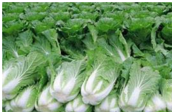
软件租用实际上是用买白菜的价钱（低成本）来获得高效益。

可在 3Hmis 中实现与现实一致的组织架构，形成各层机构与其职能相适应的综合性的信息管理体系，并可赋予组织机构中的每一个人一个信息保管箱，以便分门别类管理个人信息，形成个人的信息管理系统，信息保管箱的容量由系统管理员根据工作需要设定。面向对象的管理技术，使得用户只要进行简单的定义，就可创建自己的管理应用。比如说，创建一个安全管理对象，并需要根据需要建立管理架构，即形成一个安全管理系统，可开始安全管理工作。