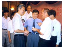
高校与政府领导参加公司活动