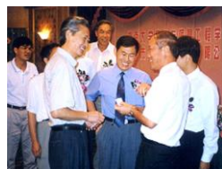
高校与政府领导参加公司活动